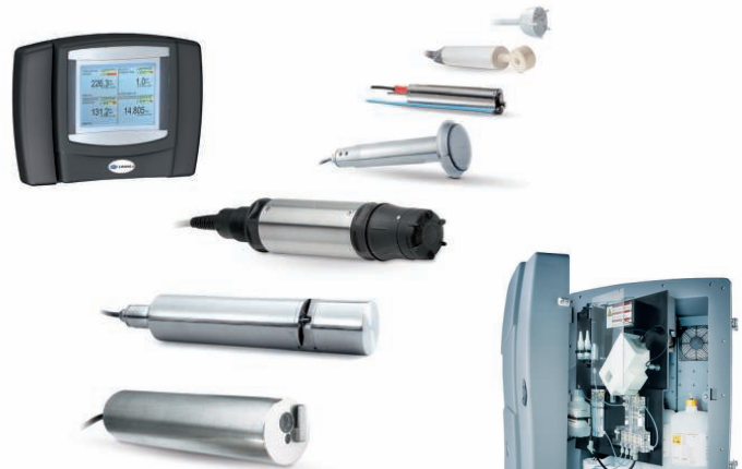
Controladores y sensores para análisis en continuo y optimización de costes de los procesos