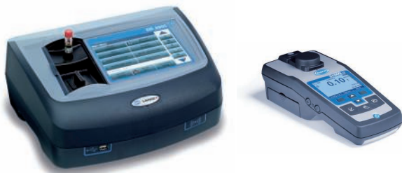
Instrumentos portátiles y de sobremesa para análisis de laboratorio Disponibilidad de servicios de inspección, mantenimiento y cualificación del equipo

* Para obtener información sobre otros parámetros y soluciones, póngase en contacto con el representante local de HACH LANGE o visite nuestra página web.