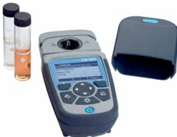
DR 900 con tapa abierta y cubetas de muestra

La combinación de todas estas características y una pantalla retroiluminada con pulsador de botón para entornos de escasa iluminación le permiten disponer de un colorímetro de mano listo para usar sobre el terreno en cualquier situación posible y que simplifica los análisis en los entornos más difíciles.