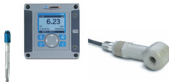
Controladores y sensores para análisis en continuo